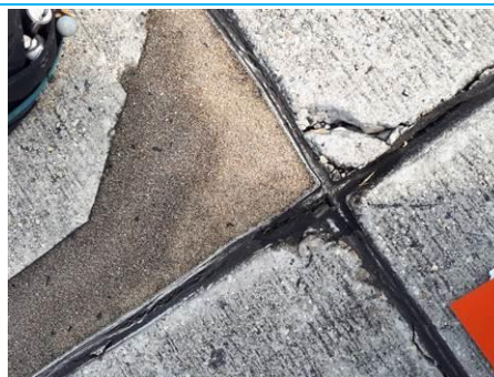
Matériaux : ZPSO-004 Prélèvement : P004 Description : Joint de dilatation Localisation : Parking Bravo Résultat : Absence d'amiante