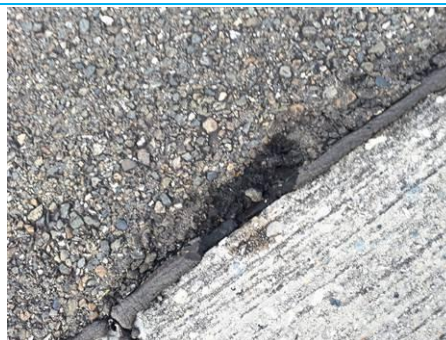
Matériaux : ZPSO-002 Prélèvement : P002 Description : Joint de dilatation Localisation : Parking Bravo Résultat : Absence d'amiante