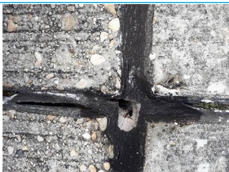
Matériaux : ZPSO-005 Prélèvement : P005 Description : Joint de dilatation Localisation : Parking Bravo Résultat : Absence d'amiante