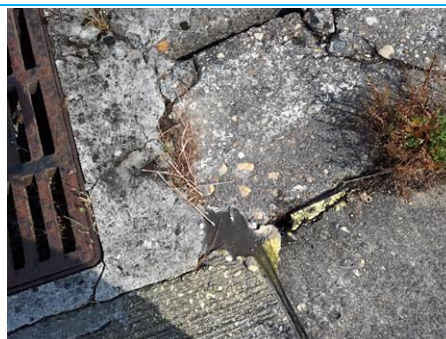
Matériaux : ZPSO-006 Prélèvement : P006 Description : Joint de dilatation Localisation : Parking Bravo Résultat : Absence d'amiante