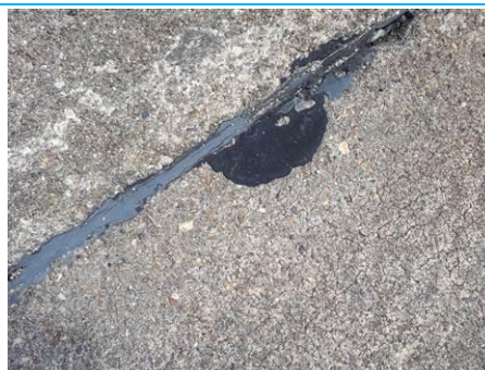
Matériaux : ZPSO-010 Prélèvement : P010 Description : Joint de dilatation Localisation : Parking Bravo Résultat : Absence d'amiante