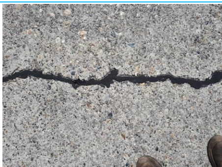
Matériaux : ZPSO-009 Prélèvement : P009 Description : Joint de dilatation Localisation : Parking Bravo Résultat : Absence d'amiante