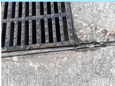
Matériaux : ZPSO-001 Prélèvement : P001 Description : Joint de dilatation Localisation : Parking Bravo Résultat : Absence d'amiante