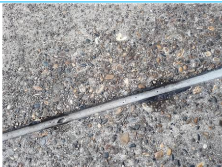
Matériaux : ZPSO-007 Prélèvement : P007 Description : Joint de dilatation Localisation : Parking Bravo Résultat : Absence d'amiante