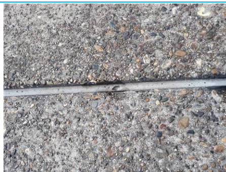
Matériaux : ZPSO-008 Prélèvement : P008 Description : Joint de dilatation Localisation : Parking Bravo Résultat : Absence d'amiante